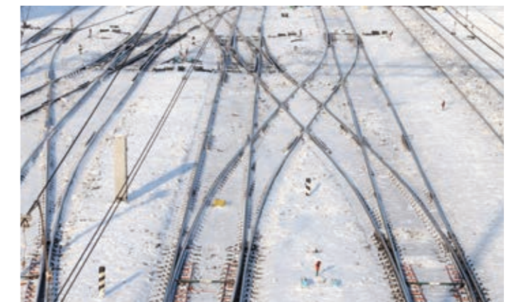
Systèmes de chauffage des aiguillages nVent ERICO et RAYCHEM