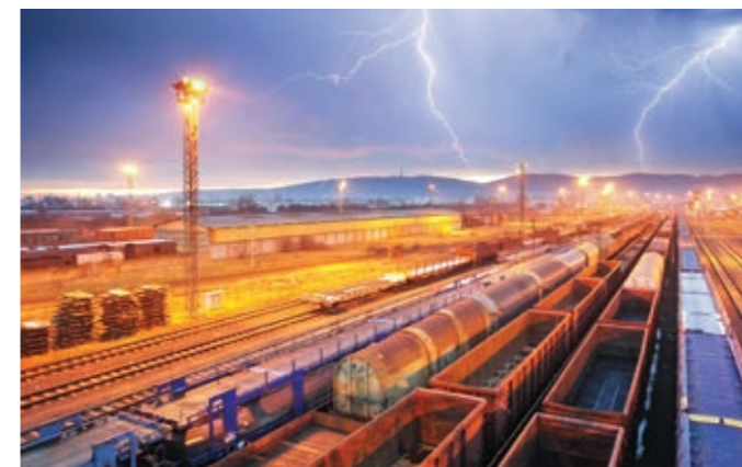
Protection contre les surtensions dues à la foudre nVent ERICO

Avec notre ligne de solutions d'habillage, composée des gammes de produits HOFFMAN et SCHROFF, nous protégeons les composants système critiques contre les éléments. Les armoires, baies et bâtis nVent sont conçus pour résister aux environnements difficiles et supporter les chocs et vibrations des trains sur la voie. Ces armoires offrent des solutions pour une régulation interne de la température comprenant des systèmes de refroidissement et d'échangeur thermique. nVent propose également de nombreuses solutions pour assurer la sécurité en hiver, le confort et les performances des voies ferrées fonctionnant dans des conditions de froid extrême. Les voies gelées ne posent pas de problème pour nos systèmes de chauffage pour rails de contact et aiguillages, dotés de la technologie innovante des produits nVent ERICO et RAYCHEM. Les solutions thermiques nVent ne se limitent pas à la voie et incluent les structures ferroviaires, comme le chauffage de la plate-forme de montée, ainsi qu'à bord des trains, avec des solutions de chauffage du seuil (passage de porte). Outre les systèmes de chauffage, les solutions thermiques nVent comptent un câblage pare-feu pour les applications dans les gares et tunnels ferroviaires.