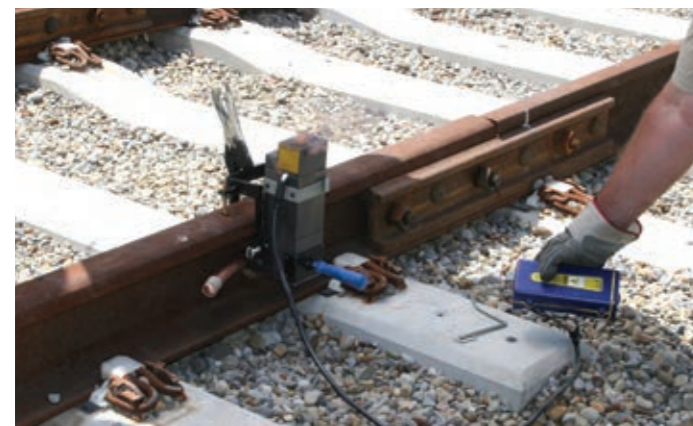
nVent ERICO Cadweld

Les produits nVent HOFFMAN comprennent des armoires et coffrets muraux pour applications outdoor en bordure de voie, ainsi que des armoires indoor pour les applications à bord des trains et bâtiments réseau. Des baies indoor et outdoor innovantes, des bâtis et des bacs à cartes pour les applications en bordure de voie, de matériel roulant et de structure réseau sont la force de nVent SCHROFF. Ces solutions d'habillage s'intègrent aisément et protègent les composants essentiels à la sécurité et fiabilité des voies ferrées.